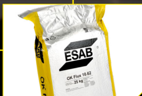
ESAB OK Flux 10.62