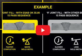
MMA elektroodi tõhususe video