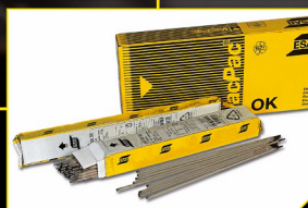
ESAB OK 61.30 Elektroodid