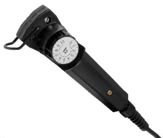
MMA 3 – traditsiooniline kaugjuhtimispult voolutugevuse reguleerimiseks